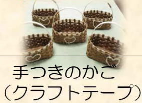
手つきのかご (クラフトテープ)