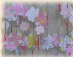
サクラのカーテン (折り紙)