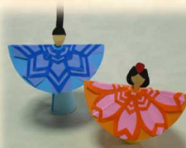
おひなさま (折り紙)