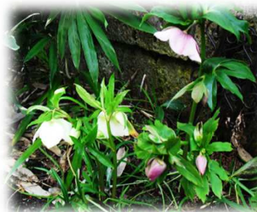
クリスマスローズも 綺麗です!!