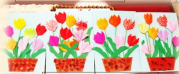
チューリップ (折り紙)