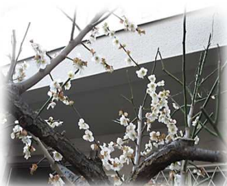
すずらん玄関前の 梅が咲きました