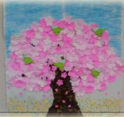
桜と菜の花 (折り紙)