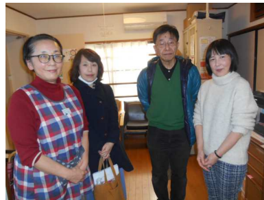
運営推進会議開催後に