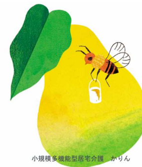
小規模多機能型居宅介護 かりん